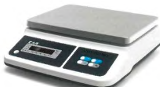
Модификация PRII-X1ED со светодиодным показывающим устройством