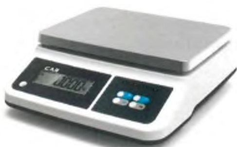
Модификация PRII-X1CD с жидкокристаллическим показывающим устройством